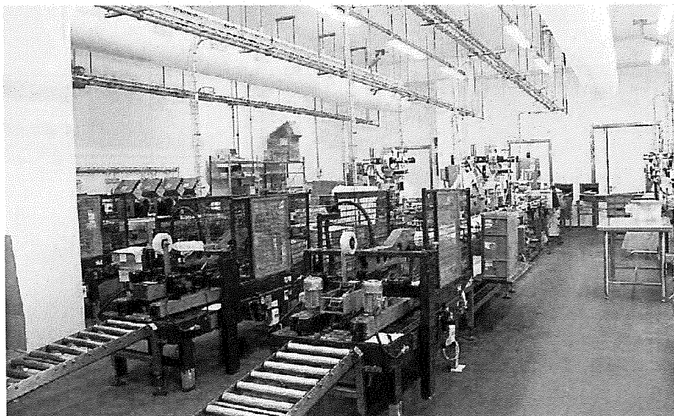
Lo stabilimento Copaim di Albinia